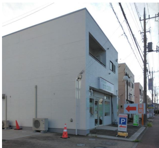
サカエ薬局様2Fです